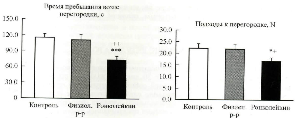
Рис. 2. Поведение контрольных и тревожно-депрессивных мышей после введения физиологического раствора и ронколейкина в тесте «перегородка».

* p < 0.05 , ** p < 0.01 vs контроль; + p < 0.05 , ++ p < 0.01 , vs «активный» контроль (физиологический раствор).